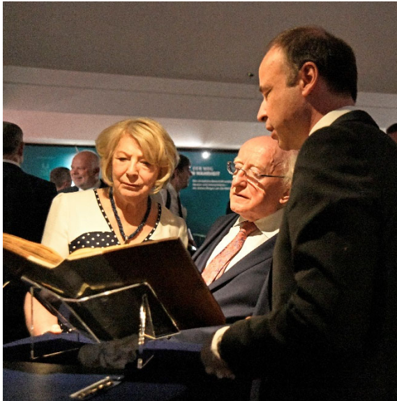
Das Präsidentenpaar bewundert die irischen Schätze in der Universitätsbibliothek.

Martyrium der drei Frankenapostel zeigt. Ein schwerer, mit Edelsteinen verzierter Silberrahmen birgt seit ca. 1495 unter Bergkristallen Reliquien der Heiligen Kilian, Kolonat und Lorenz