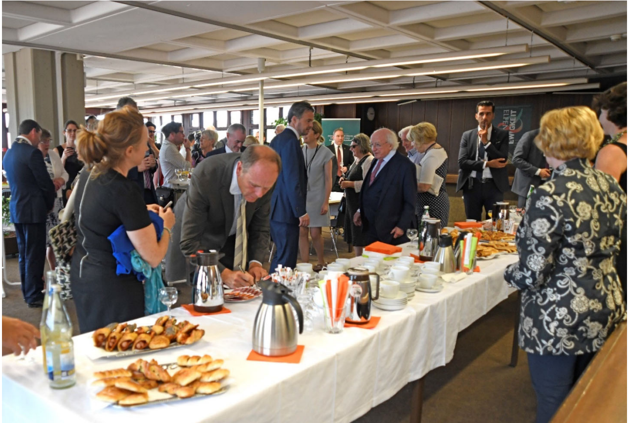
„Meet & Greet“ in lockerer Atmosphäre: Das Präsidentenpaar trifft Vertreter der Gemeinden Cavan und Wicklow sowie der Deutsch-Irischen Gesellschaft Würzburg.

ganz nahbaren, sympathischen Präsidenten beschlossen den Besuch, der ganz eindrücklich in Erinnerung rief, dass Europa nicht nur aus einem Wirtschaftsraum und aktuellen Debatten um Brexit-Szenarien und Migrationspolitik besteht, sondern auch aus einer jahrhundertealten gemeinsamen Kultur und gemeinsamen Werten. Dass der Handschriftenbestand der Universitätsbibliothek herausragende Zeugnisse dieser jahrhundertealten Beziehung zwischen Irland und Deutschland bereithält, unterstrich dieser außergewöhnliche Staatsbesuch an der Julius-Maximilians-Universität.