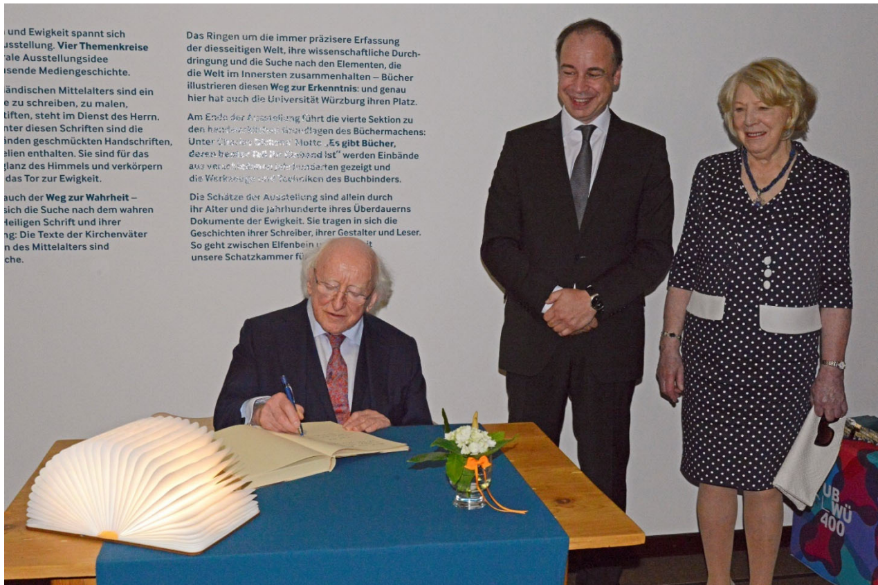
Der irische Präsident Michael D. Higgins und seine Frau Sabina Higgins tragen sich in das Gästebuch der Universitätsbibliothek ein.