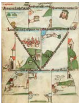
Bild-Text-Erzählungen aus 1000 Jahren Buchgeschichte illustrieren in dieser Veranstaltung, dass sprechende Bilder keine Erfindung der Comic-Industrie und unserer modernen digitalen Welt sind. Der Vorteil, Geschichten in Bildern zu erzählen, liegt auf der Hand – im Mittelalter und heute: Bilder wirken auch dann, wenn man der Sprache nicht mächtig ist – sei es, weil man nicht lesen oder kein Latein kann, sei es, weil Bilder eine künstlerische Sprache sprechen, die Texte nicht zu sprechen vermögen oder einfach, weil eine Bildergeschichte weniger Text enthält und kurzweiliger zu lesen ist.

Begleiten Sie uns in dieser ganz besonderen Veranstaltung in eine Bilder- und Textwelt, die sich gegenseitig bedingt und bereichert und den Bogen vom mittelalterlichen Heilsspiegel bis zur modernen „graphic novel“ spannt!