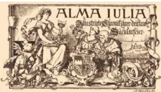
Zeichnung von Franz von Stück aus der Festschrift zur 300-Jahr-Feier der Universität: Alma Iulia, Würzburg 1882. UB Würzburg, 25/Rp 14, 4.63a, S.73